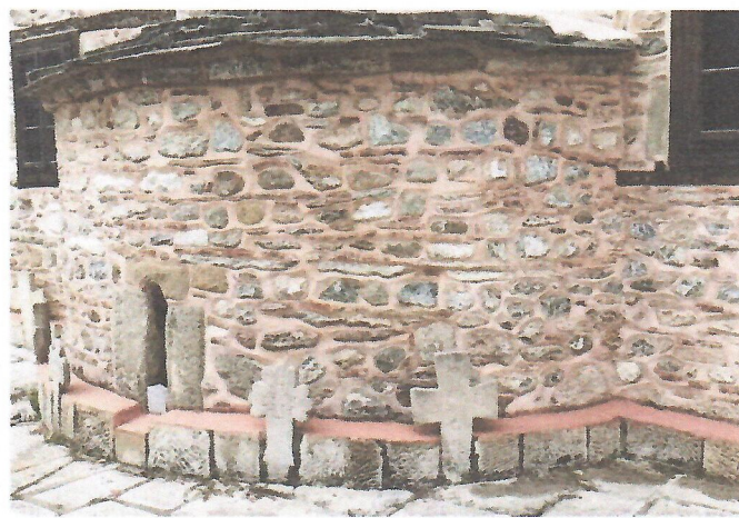
Ургентни интервенции на црквата