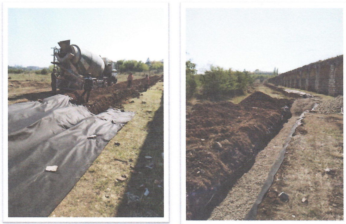
Дренажен канал на Аквадуктот

6.4. Во тек е реализација на првата фаза на Основниот проект за конзерваторско-реставраторски работи на Аквадуктот во Скопје, а по распишана јавна набавка и во рамките на одобрените средства. Првата фаза опфаќа изведба на дренажен канал и стабилизација на 6 од инклинираните столбови. Со проектот е предвидено стабилизација на 10 инклинирани столбови.